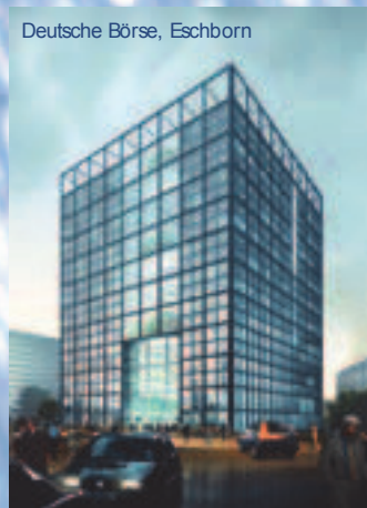
Deutsche Börse, Eschborn