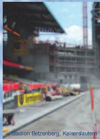
Stadion Betzenberg, Kaiserslautern